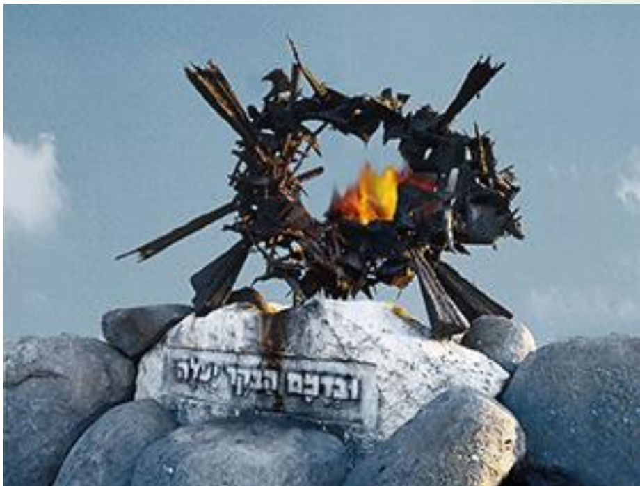
פינת הנצחה לנופלים במערכות ישראל שוהם