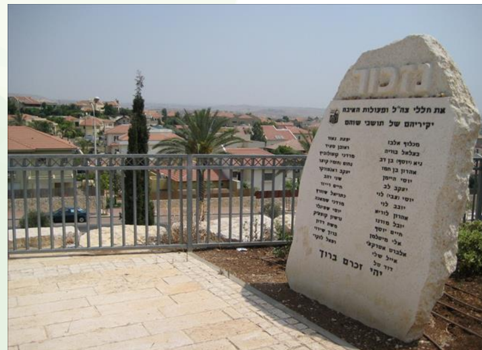
אנדרטה לזכר הנופלים במערכות ישראל שוהם